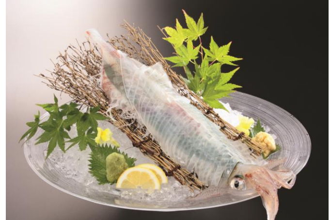
活イカの活き造り