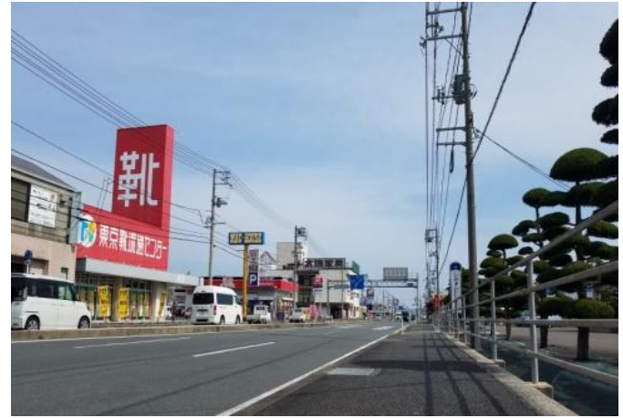
深川地域 主要道路の様子