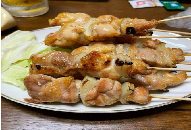
ぷりぷりジューシーな長州どりのやきとり

長門市は人口1万人あたりのやきとり店舗数が全国トップクラスを誇るやきとりのまちです。やきとり店が多い要因としては、西日本有数のブロイラー生産量を誇る全国的にも珍しい養鶏専門の農業協同組合「深川養鶏農業協同組合」の存在があげられます。その日の朝に締めた新鮮な鶏肉を串に刺し、ガーリックパウダーと七味をかけて食べるのが長門流です。深川地域には、焼き鳥店が多く、おいしい焼き鳥がいつでも楽しめます。