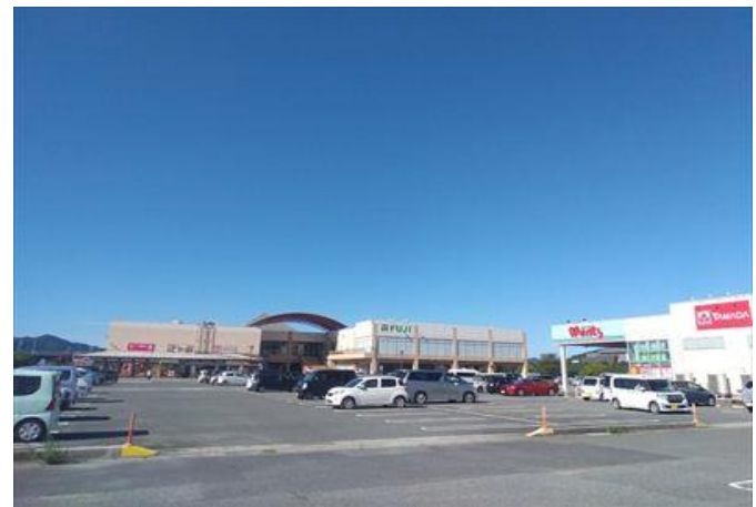
深川地域 総合スーパーフジ長門店