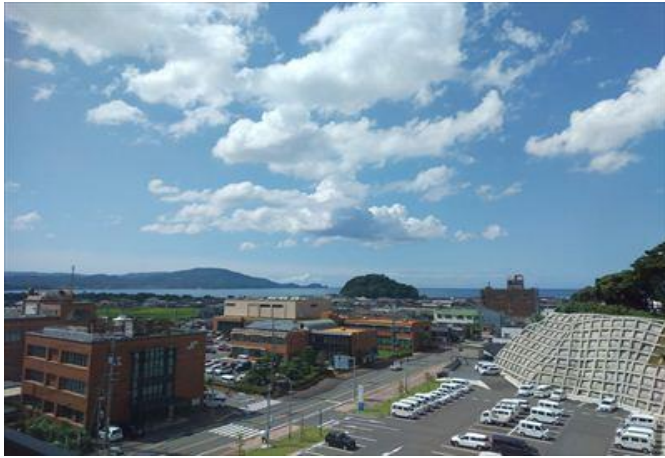
深川地域 市役所から見る深川地域

地域内に長門市で唯一の総合病院をはじめ、市役所、図書館、総合公園などがあります。保育、教育施設も充実しており、幼稚園・保育園各2園、小学校・中学校各2校、高校3校があり、子育て世代に人気のエリアです。市の中心エリアのため、生活に必要な物は近くで購入できるのはもちろん、海・山へのアクセスも良く、ほどよく田舎暮らしを楽しみたい方にお勧めの地域です。