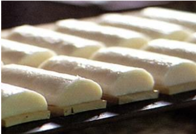
仙崎蒲鉾は、新鮮な海の幸が集まる魚市場から生まれた長門市の食文化の代表格

長門市仙崎の蒲鉾は地域独特の「焼きぬき蒲鉾」として有名です。味わいはきめ細かく、しこっとした歯ごたえの良さが特徴です。