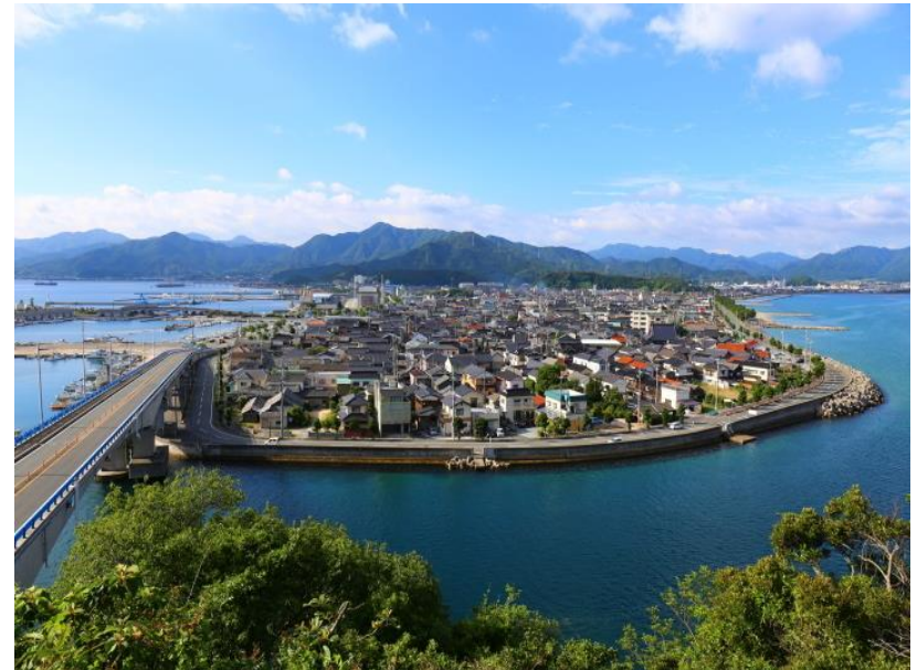
仙崎地域 王子山(おうじやま)から見る、海に囲まれた仙崎の町

長門市の中でも最も居住人口が多い地域です。総合病院、総合スーパー、図書館、総合公園などがあり、生活に不便さを感じるシーンは少ない地域です。