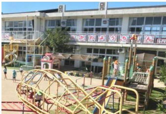
認定こども園 深川幼稚園