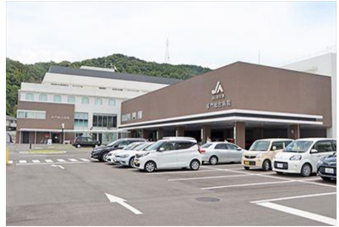
深川地域 長門総合病院