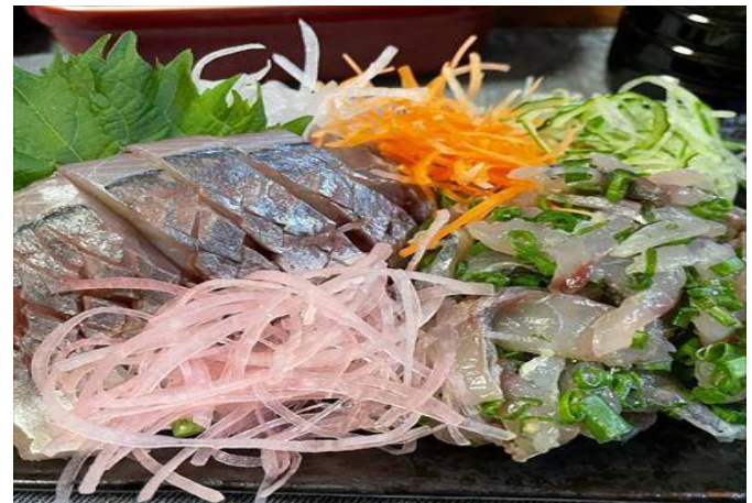
脂乗りが良く、刺身にすると、とろける美味しさです