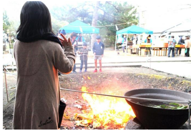
仙崎地域 八坂神社どんど焼き