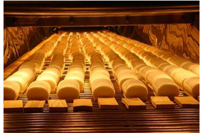
蒸さずに、杉板の裏から加熱することで、しこっとした歯ごたえが生まれる