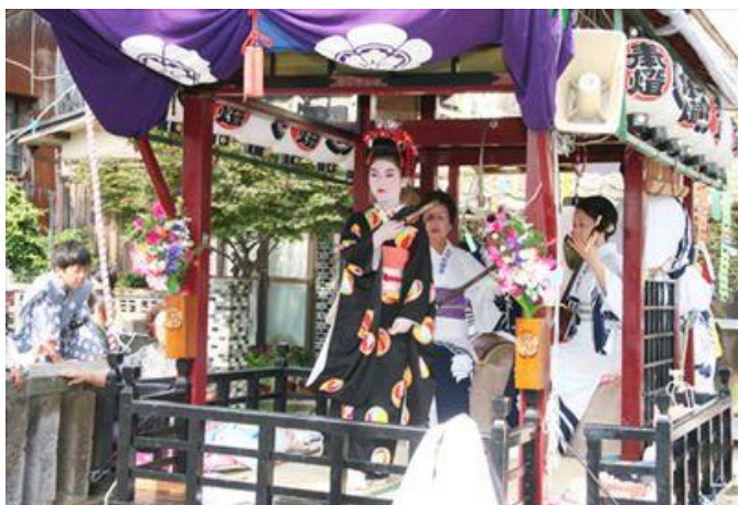
仙崎地域 仙崎祇園祭