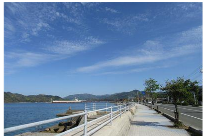
仙崎地域 海岸線道路の様子