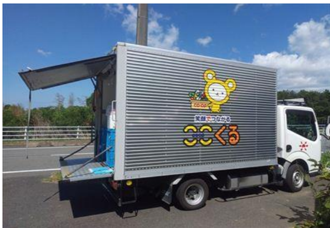
コープやまぐちによる週1回の宅配サービス車