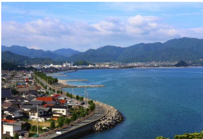
仙崎地域 王子山公園から見る仙崎・深川地域