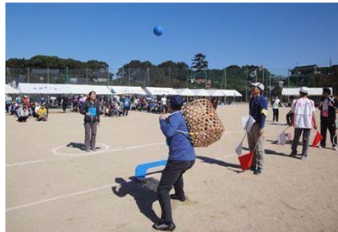
深川地域 地区体育祭の様子