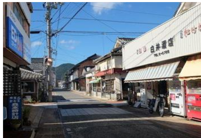
仙崎地域 金子みすゞの詩にも登場する角の乾物屋 (白井商店)