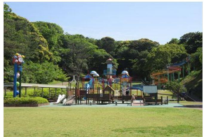
仙崎地域 長門市総合公園