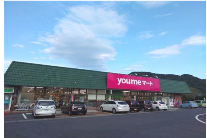
深川地域 ゆめマート板持店