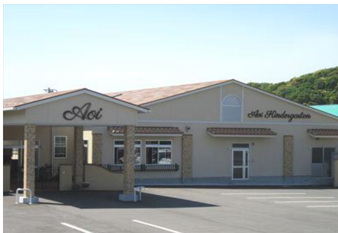
認定こども園 あおい幼稚園