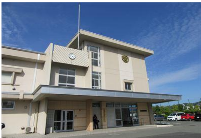
山口県立大津緑洋高等学校 大津校舎