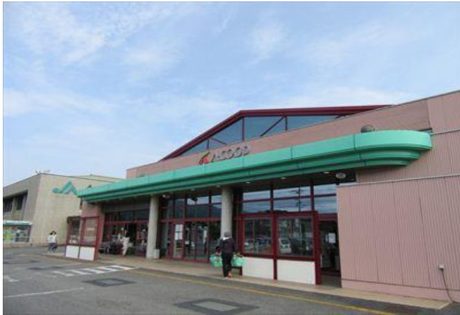
深川地域 JA直売店舗 Aコープ長門店

◆総合スーパーフジ長門店に隣接して、ドラッグストア、電気店、クリーニング店、花屋、コインランドリー等があります。