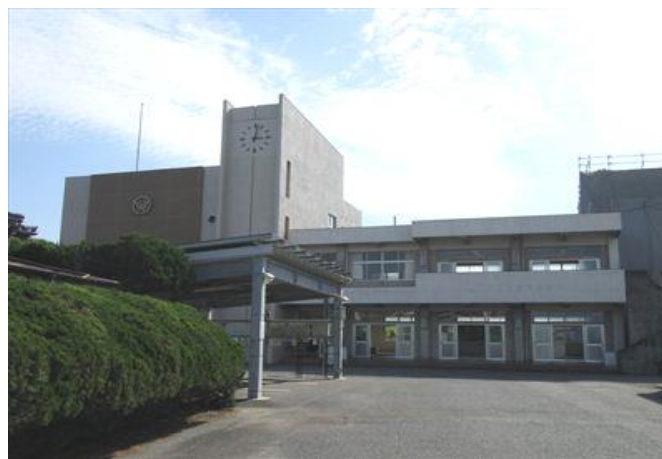
山口県立大津緑洋高等学校 水産校舎