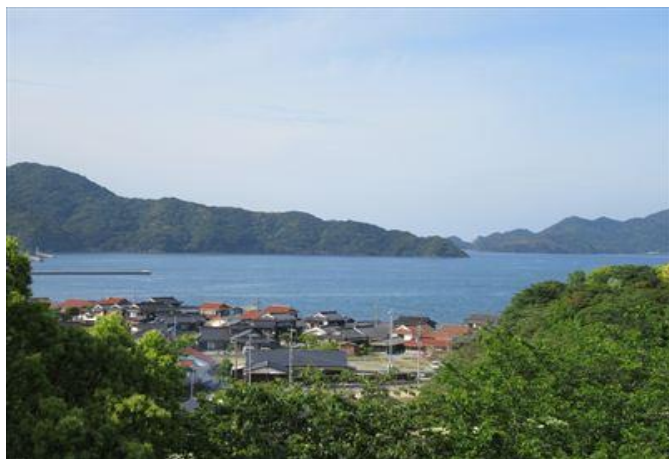
仙崎地域 みすゞ公園から見る仙崎湾