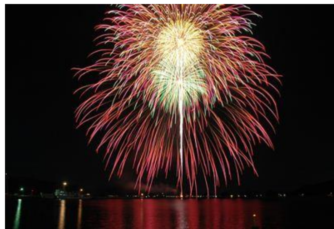
深川地域 ながと花火大会