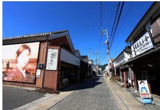
金子みすゞが幼少期を過ごした仙崎の町並み