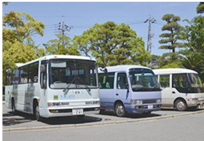
各方面からのスクールバス運行しています(HPより)