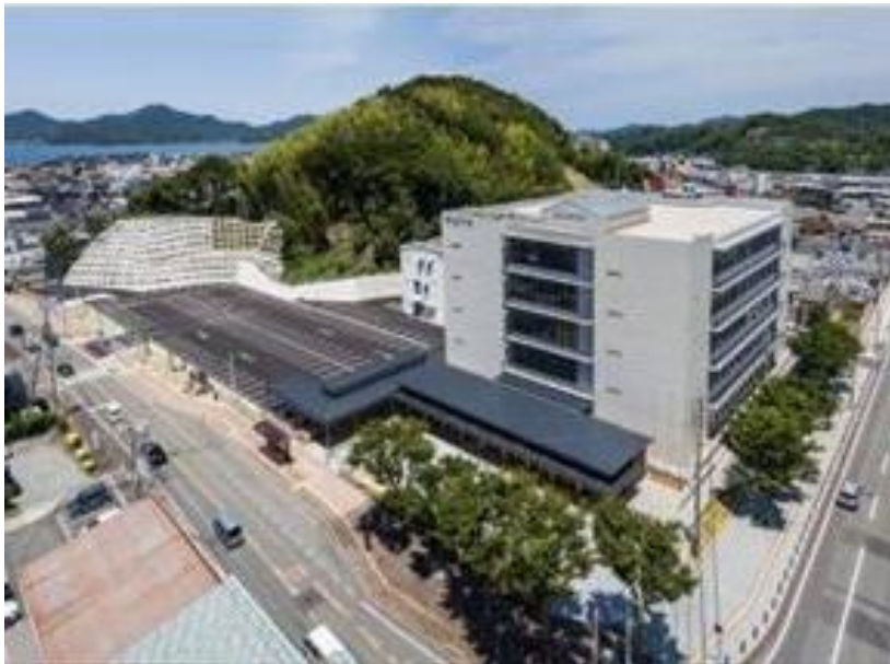
深川地域の中心にある長門市役所周辺