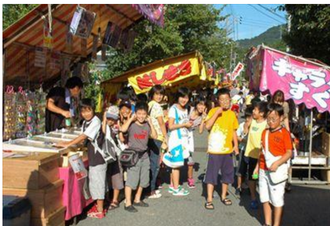
深川地域 赤崎祭り