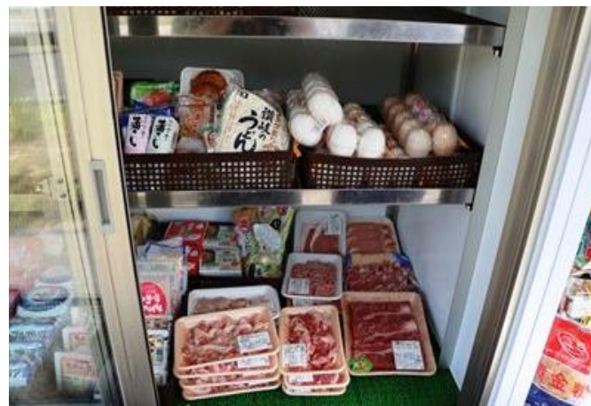
おひさま号では精肉や鮮魚、お惣菜なども購入可能