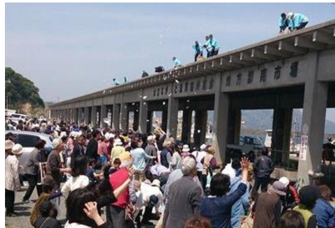
深川地域 みなとげんき祭り(長門市の祭りでは恒例行事の餅まき)