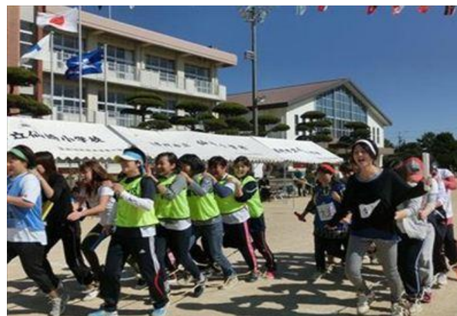
仙崎地域 地区体育祭の様子