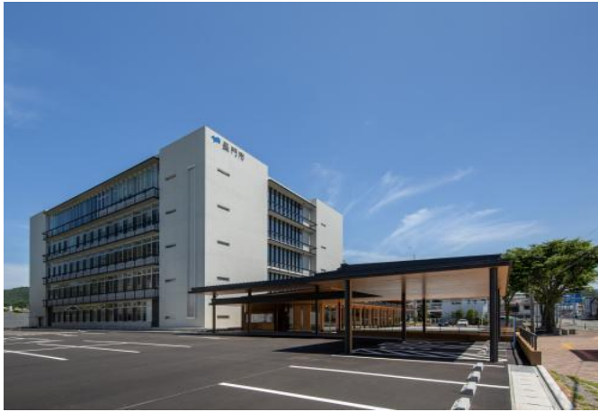
深川地域 長門市役所

地域内に長門市で唯一の総合病院をはじめ、市役所、図書館、総合公園などがあります。保育、教育施設も充実しており、幼稚園・保育園各2園、小学校・中学校各2校、高校3校があり、子育て世代に人気のエリアです。市の中心エリアのため、生活に必要な物は近くで購入できるのはもちろん、海・山へのアクセスも良く、ほどよく田舎暮らしを楽しみたい方にお勧めの地域です。