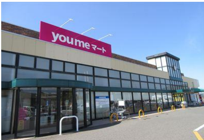
仙崎地域 ゆめマート南仙崎店