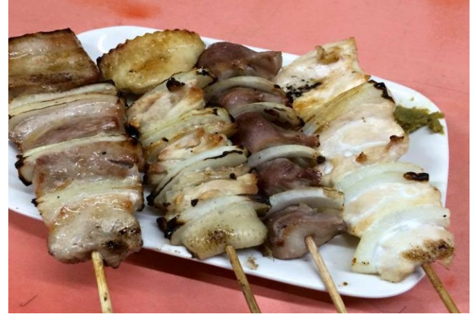
長ネギではなく、玉ねぎを挟むのが長門流