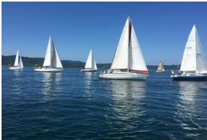
仙崎地域 長門ヨットフェスタ

10月 深川地区体育祭 仙崎地区体育祭 11月 ながとご当地グルメ祭り 仙崎公民館祭り 2月 節分祭 八坂神社どんど焼き 3月 青海島観光汽船安全祈願祭