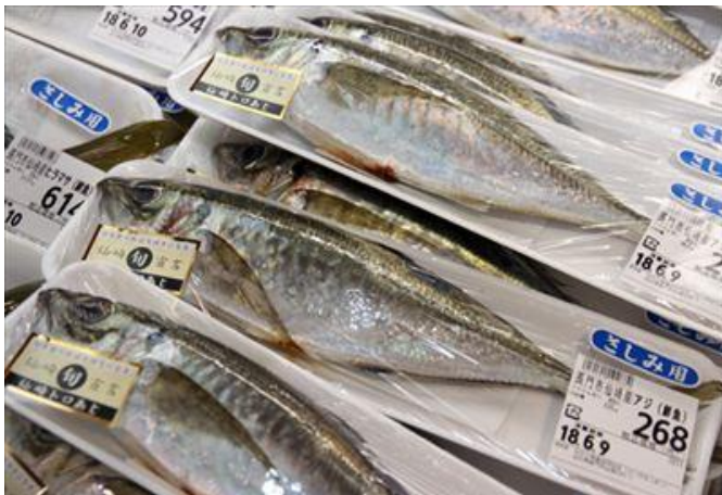
道の駅センザキッチンなどで販売される仙崎トロあじ

毎年6月頃、仙崎市場で水揚げされるマアジが旬の時期を迎え、消費者に「おいしい魚を食べてほしい」「魚の旬を大切にしたい」という思いから一定量のマアジの脂質含有量を測定し、脂の乗ったおいしいマアジが食べられる時期になると、「仙崎トロあじ」宣言が発令され、旬の味を楽しむことができます。