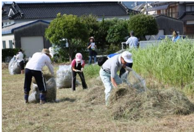
深川地域 清掃活動の様子

自分達が生活する地域を良くするため、生活道路や河川の草刈りなど、地域住民の共同作業として営まれていますので、ご協力をお願いいたします。