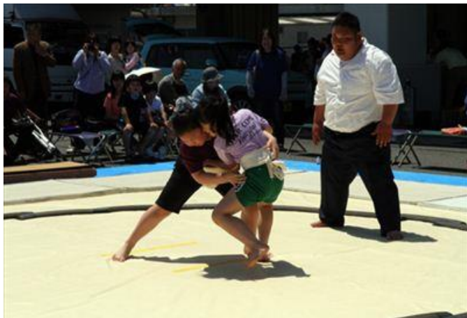
深川地域 ながと深川みなとげんき祭りでのわんぱく相撲

10月 深川地区体育祭 仙崎地区体育祭 11月 ながとご当地グルメ祭り 仙崎公民館祭り 2月 節分祭 八坂神社どんど焼き 3月 青海島観光汽船安全祈願祭