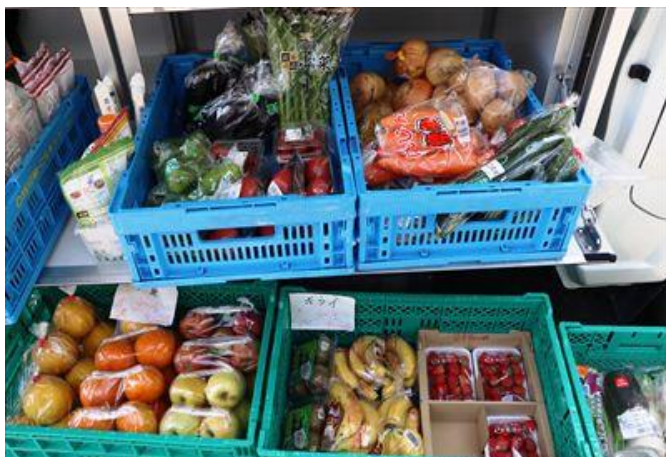
おひさま号ではコープ商品をはじめ、野菜や果物なども豊富に揃う