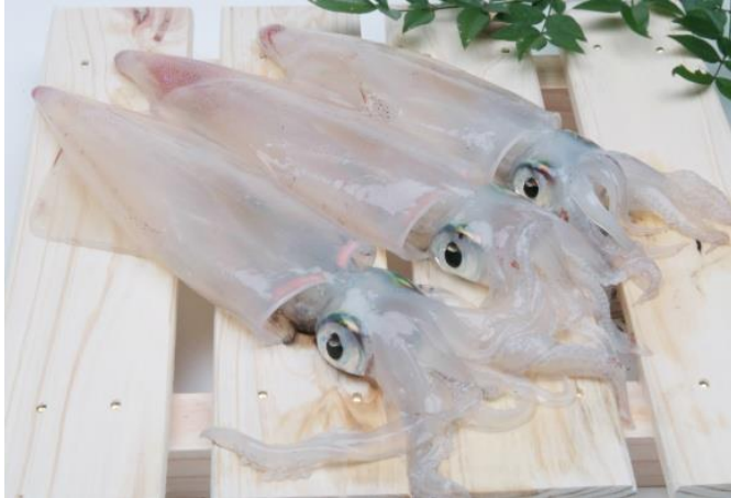
水揚げされたばかりの仙崎イカ

仙崎沖に広がる日本海は入り組んだ地形と激しい潮流がぶつかりあう、日本でも屈指の漁場です。その激しい潮流にもまれて仙崎イカは育ちます。活きが良いイカは、その鮮度ゆえに透明です。身の引き締まった、鮮度抜群のおいしいイカを味わってください。