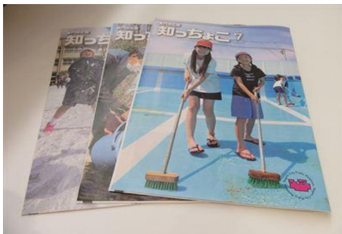
市の広報紙や回覧板なども自治会を通じて配布される