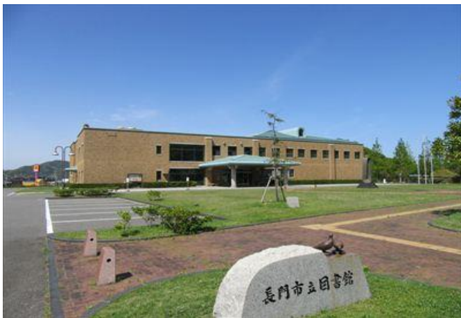
仙崎地域 長門市立図書館