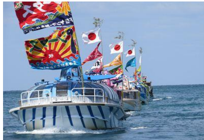
仙崎地域 青海島観光汽船安全祈願祭