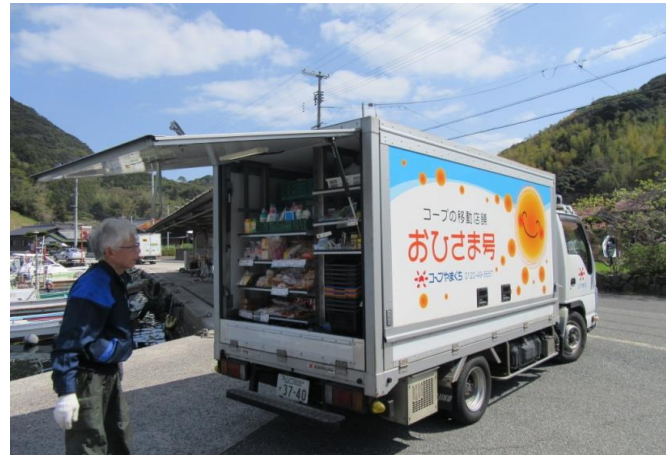
仙崎地域 おひさま号移動販売風景